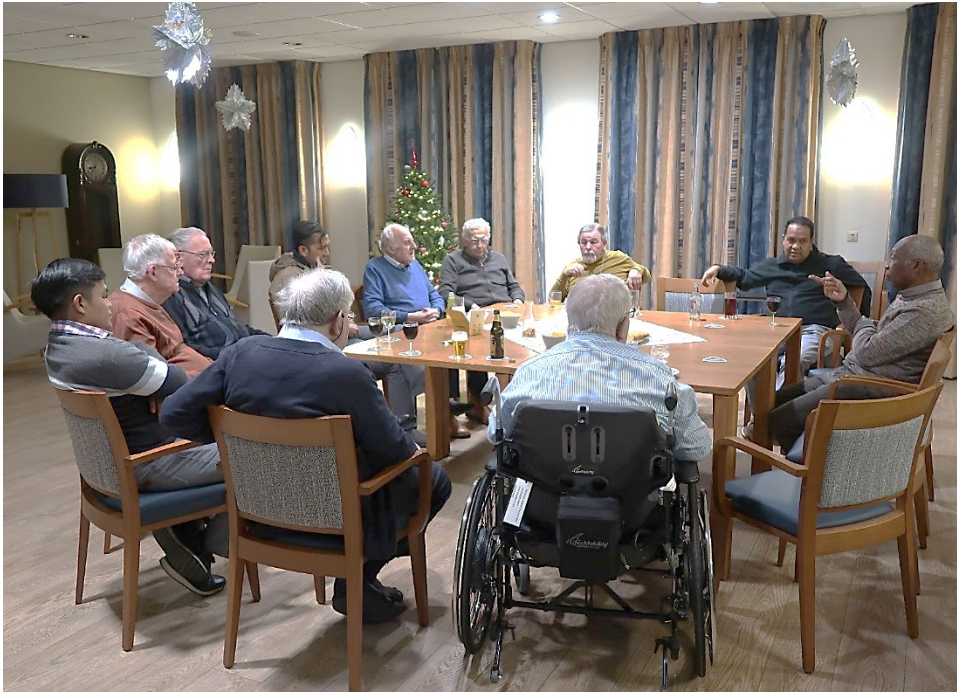
Afscheidsavond in de sfeervolle woonkamer van broederhuis Depoorter.

over wat er komt kijken om als religieus van Indonesië naar Nederland te kunnen komen. Dit kan ook voor onze congregatie belangrijk zijn.