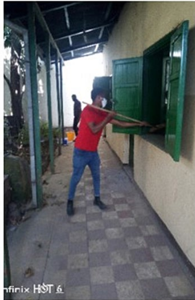
Eten maken. (l.) Kuisen. (r.)