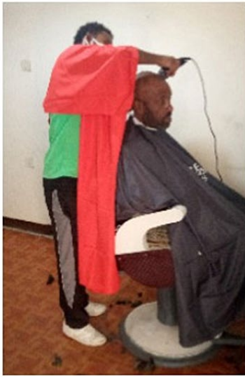
Activiteiten in het Elderly People Project. Kapper. (l.) Hygiëne. (r. & ond.)